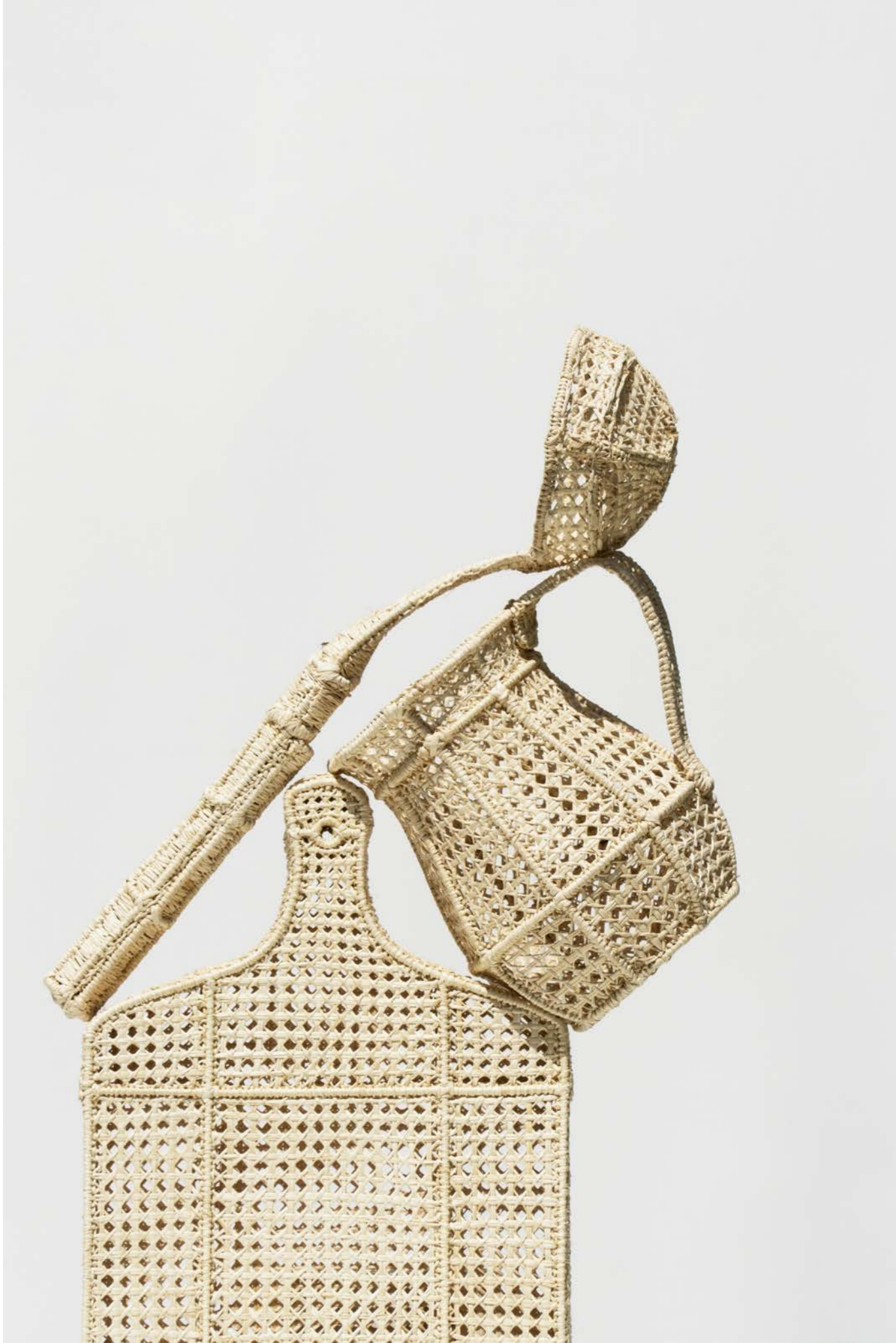
Todo es irreal